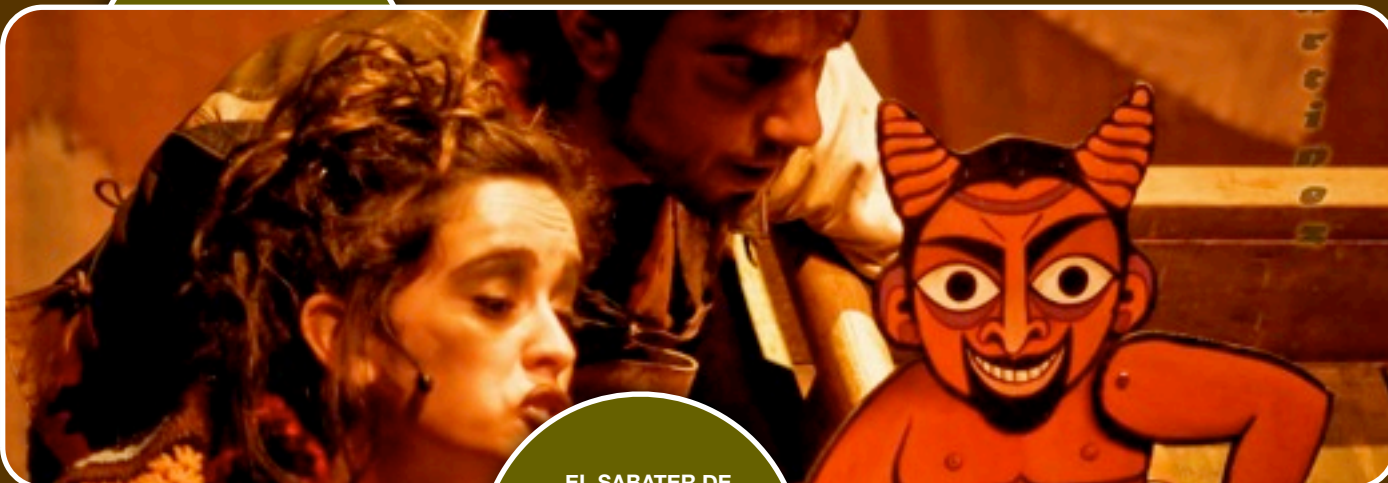
EL SABATER DE TORREGROSSA